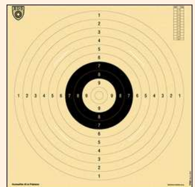
Scheibe für Präzision

Wertung: Die 20 Schuss Präzision können getrennt von den 40 Schuss Kombi gewertet werden, so dass auch nur Präzision geschossen werden kann.