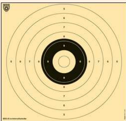
Scheibe für Intervall und Zeitserie